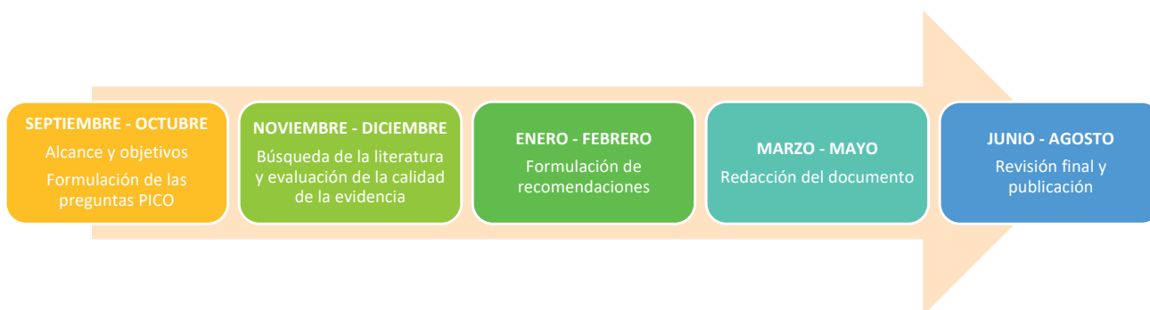
Figura 2. Metodología de elaboración de la guía. Elaboración propia.

La guía fue elaborada de septiembre de 2023 a agosto de 2024. (Figura 2)