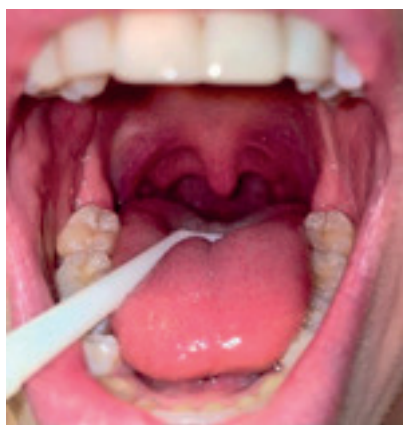
Figura 3. Orofaringe del paciente posterior a la extracción del tonsilolito. Imagen tomada del paciente.

La evolución posoperatoria fue adecuada y la cicatrización por segunda intención no tuvo complicaciones ( Figura 3 ). Se solicita imagen posoperatoria que demuestra la ausencia de lesiones o residuos ( Figura 1B ).