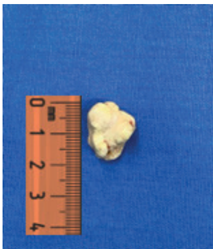
Figura 2. Imagen en la que se evidencia un tonsilolito gigante que mide, en uno de sus diámetros, aproximadamente 19 mm. Imagen tomada del paciente.

El paciente acude a consulta de otorrinolaringología, donde no se evidencian alteraciones al examen físico, pero se palpa una masa pétreo a nivel orofaríngeo derecho sobre el pilar anterior en relación con el polo superior de la amígdala palatina. Se intenta la extracción manual por expresión, pero sin éxito, por lo cual se programa para la extracción quirúrgica bajo anestesia local en consultorio. Se logra la extracción de una masa calcificada, de color blanco pardo, de 2 cm de diámetro y única ( Figura 2 ).