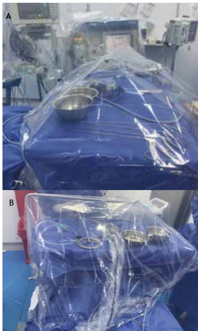
Imagen 2. A) Instrumental debajo de la mesa de suspensión laringea -Máquina de anestesia y equipos protegidos. B) Sello inferior del plástico.