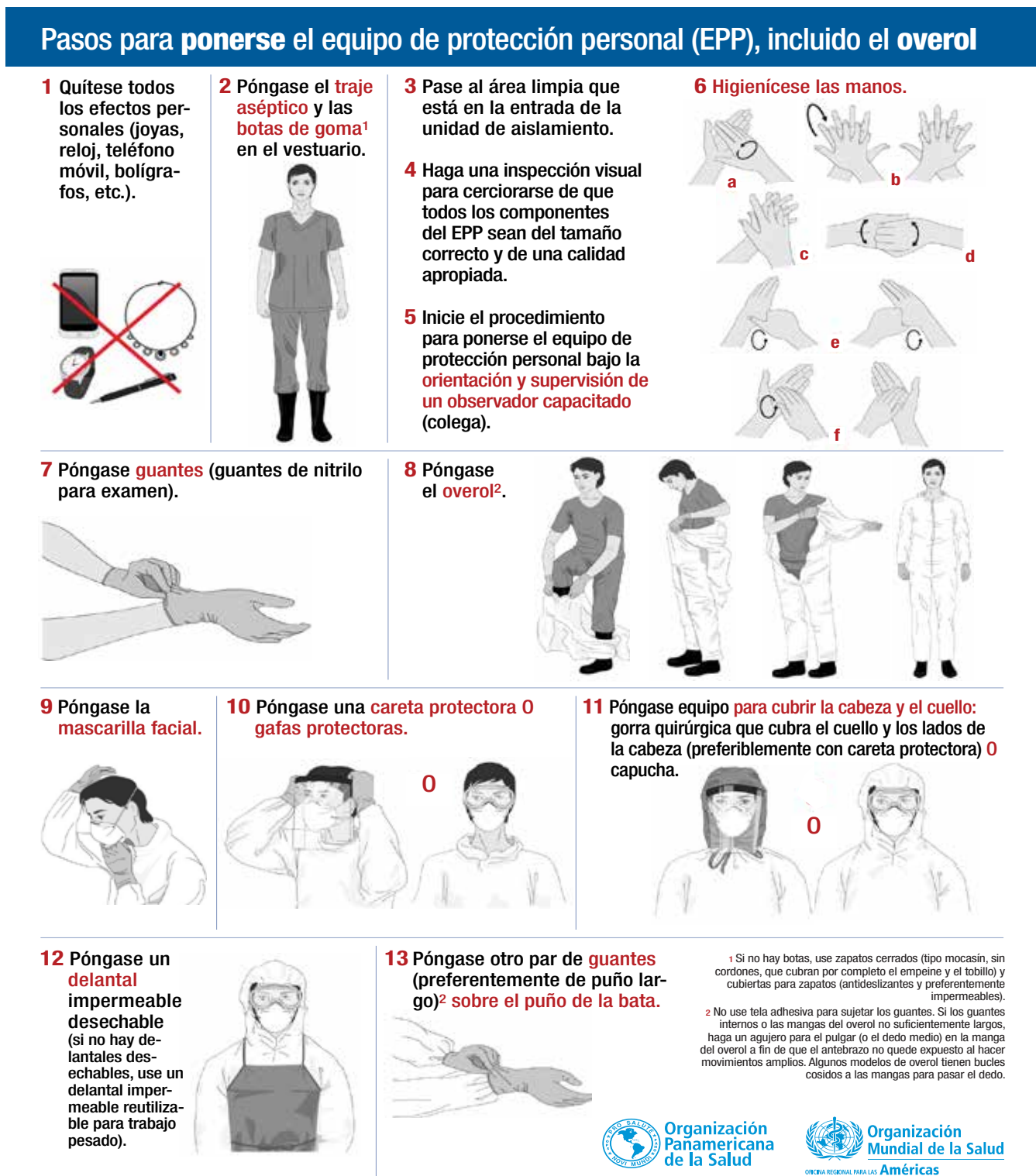
Figura 2. Pasos para ponerse el EPP, incluido el overol

La Organización Mundial de la Salud ha adoptado todas las precauciones razonables para verificar la información que figura en la presente publicación, no obstante lo cual, el material publicado se distribuye sin garantía de ningún tipo, ni explícita ni implícita. El lector es responsable de la interpretación y el uso que haga de ese material, y en ningún caso la Organización Mundial de la Salud podrá ser considerada responsable de daño alguno causado por su utilización.