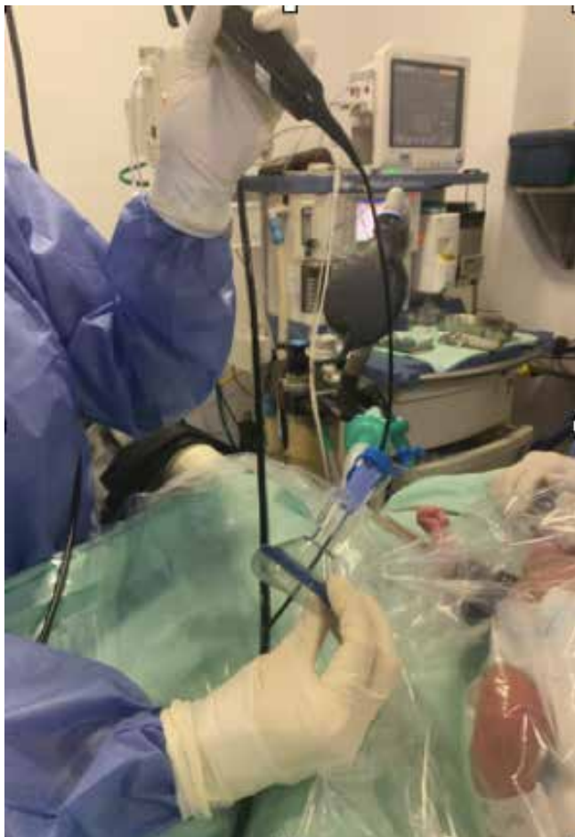
Imagen 1. Máscara facial con adaptador swivel para realización de fibronasaringoscopia despierto.

A continuación se muestra una serie de imágenes originales de los autores.