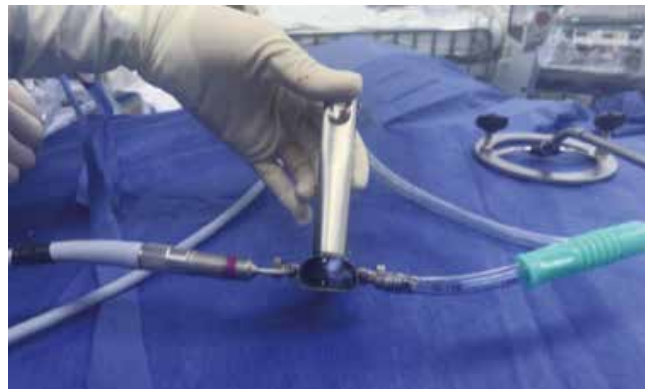
Imagen 5. Succión por el canal de ventilación del laringoscopio.