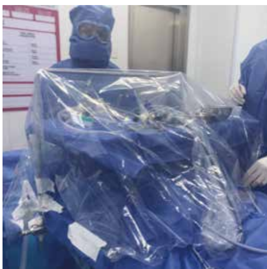
Imagen 3. Sello lateral del plástico.